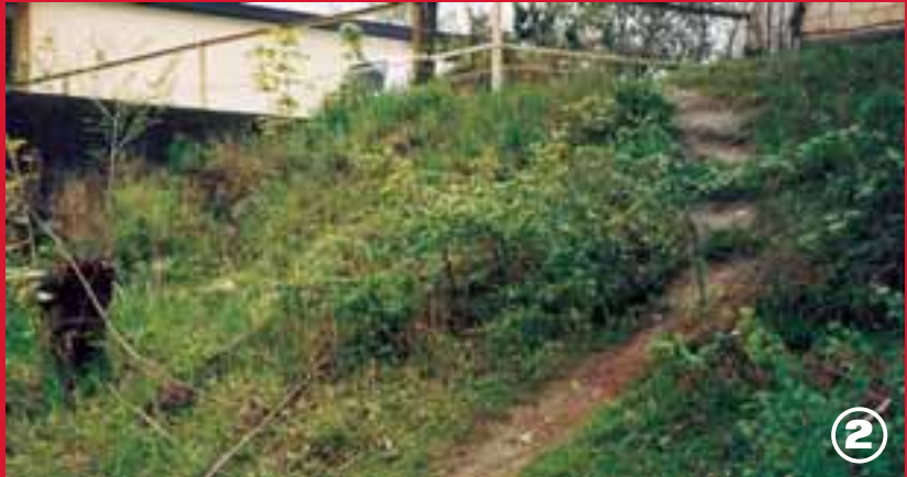
2. Achtung: Schleichweg.