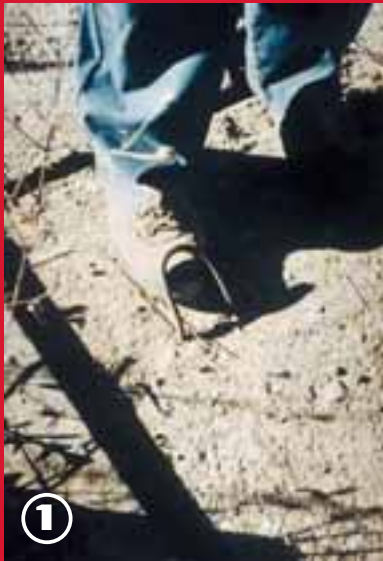
1. Achtung: „Auf-Hänger“.