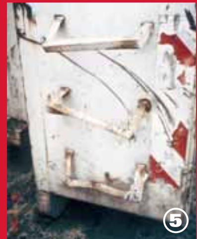
5. Achtung: Absturz.