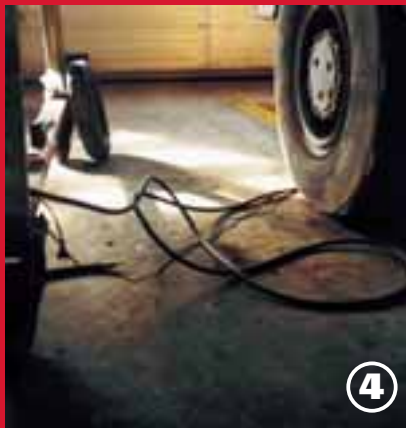
4. Achtung: Kabelsalat.