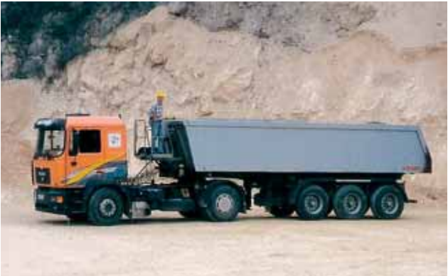
Arbeiten auf dem Fahrzeug nur von sicheren Arbeitsbühnen