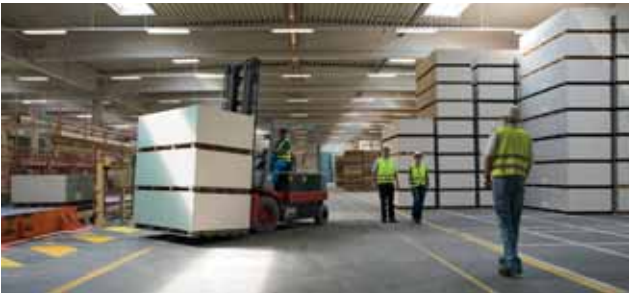
Augen auf in gemischten Verkehrsbereichen