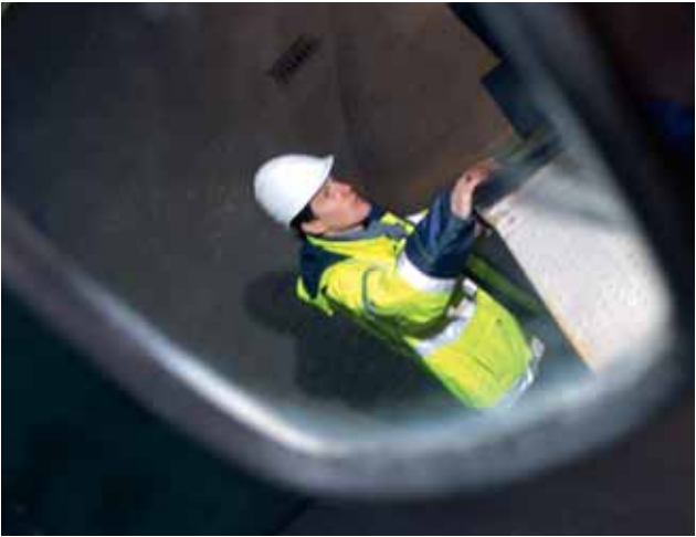
Augen auf, wenn sich Kollegen im Gefahrenbereich aufhalten