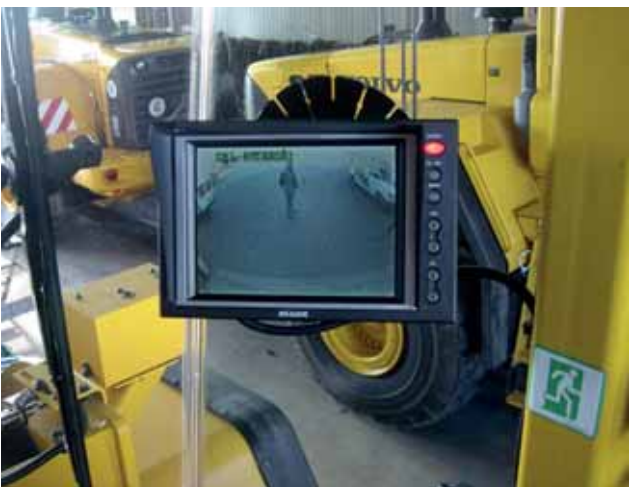
Kamera-Monitorssysteme erweitern das Sichtfeld