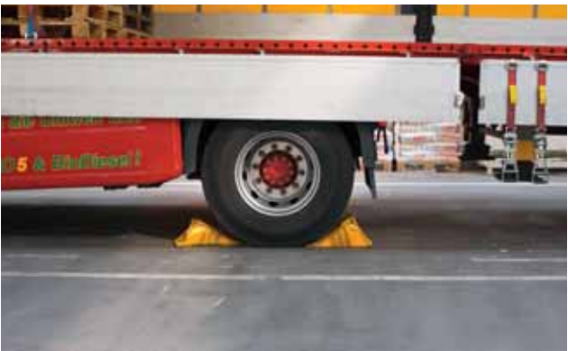
Fahrzeuge an der Be- und Entladestelle gegen Wegrollen sichern