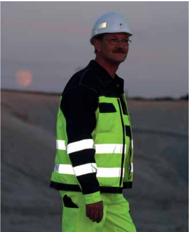
Warnschutzkleidung sorgt für Auffälligkeit bei Tag und Nacht