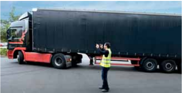
Bei nicht zu überblickendem Fahrbereich: einweisen lassen