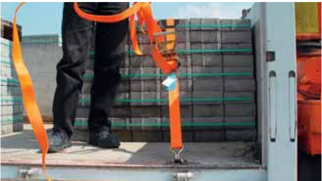
Ladung immer erst ausreichend sichern, dann starten