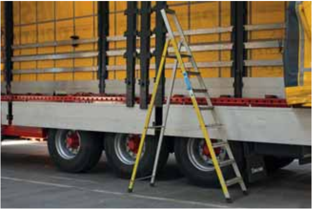
Sichere Zugänge zur Ladefläche schaffen, z. B. mit Hilfe einer Leiter